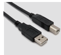
資料傳輸線(USB Type A to B)