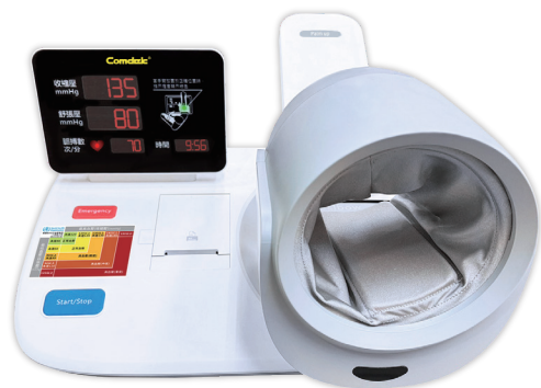
康達司隧道式血壓計 (MD-500)